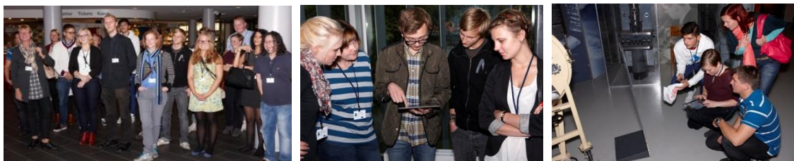
Teknisk Museum, Oslo