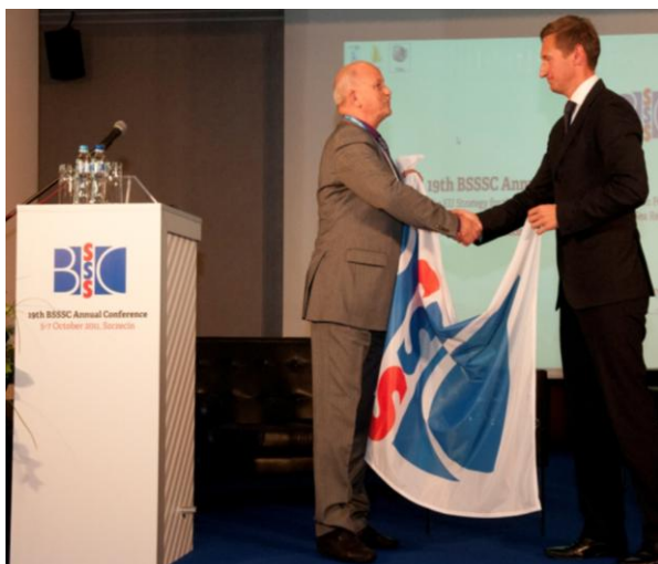
BSSSC AC 2011, Szczecin, Polen